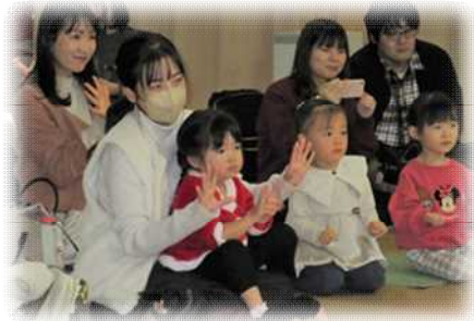
サンタさん・トナカイさん登場: