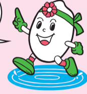
稲美町イメージキャラクター「いなっし」