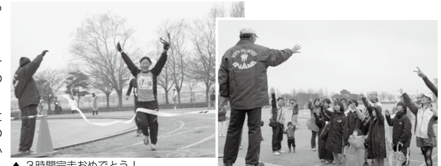
▲ 3時間完走おめでとう!

ファミリーの部に4人で参加した家族は、「一つのタスキを家族でつなぎ、楽しく走ることができてよかったです」と感想を話されました。