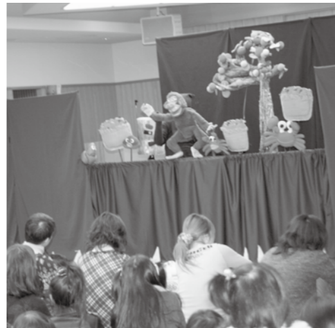
▲ 手作りの人形は愛嬌たっぷり。次々変わる人形の動きにみんなくぎ付けでした