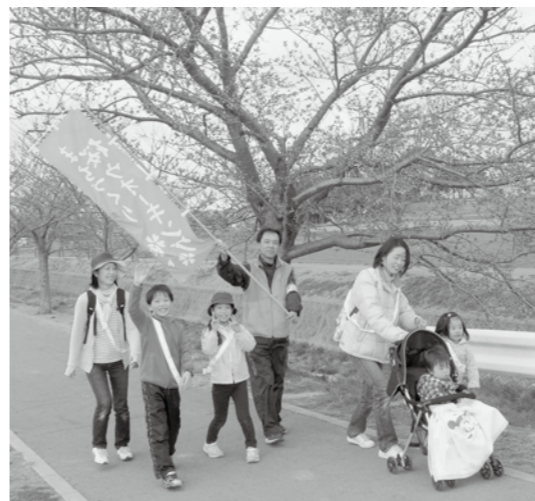
▲ 曇川沿いの桜並木もまだちらほら咲きでした。満開が待ち遠しいね