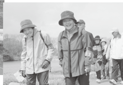
▲ 参加した人達の笑顔は満開！

ウォーキングの後は、それぞれの校区で豚丼やぜんざいなどの軽食が無料で振る舞われたほか、ビンゴゲームや抽選会、三線の生演奏などもありました。