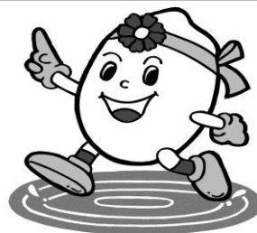
稲美町イメージキャラクター「いなっち」

登録することにより委任状の偽造による住民票の写しなどの不正請求や不正に取得するという犯罪を未然に防止することができます。また、不必要な身元調査等の未然防止につながります。