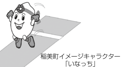
稲美町イメージキャラクター「いなっち」