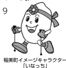
稲美町イメージキャラクター「いなっち」