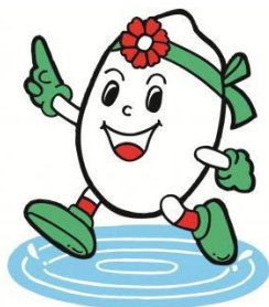
稲美町イメージキャラクター「いなっち」