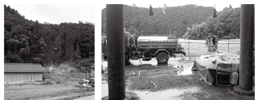
▲大雨により発生した土砂崩れ ▲給水車から簡易タンクへ給水しました

8月16日から17日にかけての記録的豪雨で、兵庫県丹波市では土砂崩れにより家が流されたり、1階が埋まるなど、深刻な被害が出ています。また、土砂崩れで浄水場が埋まったり、水道管が流されるなど長期にわたり断水が続いています。 町では応援給水の要請を受け、8月21日、31日、9月5日、13日に給水車による給水活動に参加してきました。 被災地の一日も早い復興をお祈りしています。