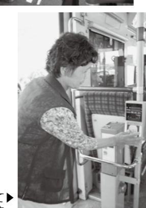
ICカードは小銭を準備しなくていいので便利です

9月9日、加古福祉会館で高齢者を対象とした「路線バスの乗車体験教室」を開催しました。 会場ではバス利用時の注意事項などを、○×クイズ形式で紹介しました。知っているようで、意外と間違えている事例があったりと、参加者はバスの正しい利用について改めて確認していました。 また、会場の外では実際のバス車両を使ってバスの乗り方教室を実施しました。 参加者はICカード乗車券の使い方や、運賃の確認方法、また乗車時に気をつけることなどの説明を聞いたり、日ごろ疑問に思っていることをバス運転手へ質問していました。 乗車体験した人は、「今までICカードの事を知らなかった。便利だとわかったので、今後使っていきたい」などと話されました。