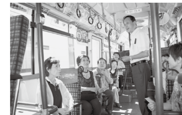
▲「転倒してけがしないよう、バスが完全に止まってからゆっくり降りましょう」