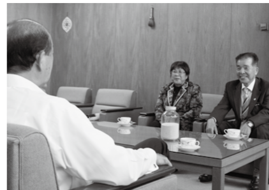
▲ 作られた粟を持って報告に来られた大村夫妻

新嘗祭とは、毎年11月23日に天皇がその年の新穀である米と粟を神にお供えされ、豊作を感謝し自らも召し上がる伝統的な祭儀です。