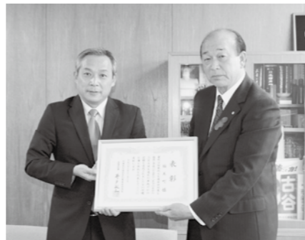
▲ 昨年の12月10日から交通死亡事故はゼロです。

みなさん一人ひとりが交通ルールを守り、安全運転を心掛け、これからも交通事故防止に努めましょう。