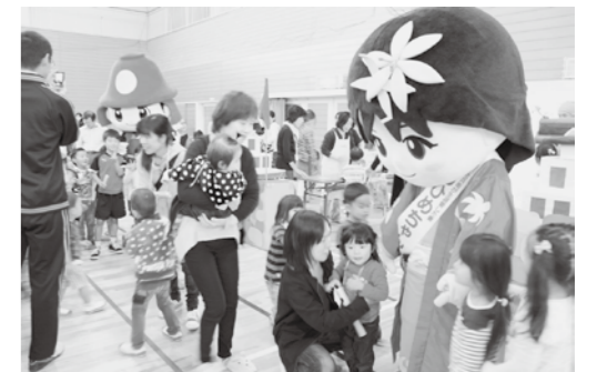
▲ 大人気の「かんべえくん」と「てるひめちゃん」