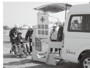
▲ 災害時要援護者避難訓練