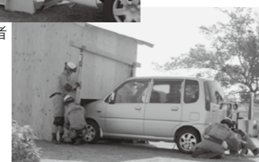
▲ 危険家屋からの救助訓練

10月27日、山崎断層帯及び草谷断層を震源とする、マグニチュード7.5の地震の発生を想定した「稲美町防災訓練」を加古大池で実施しました。