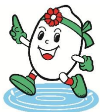
稲美町イメージキャラクター 「いなっち」