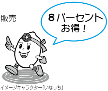
稲美町イメージキャラクター「いなっちゃん」