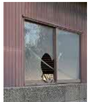
窓が割れた管理不全空家