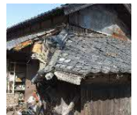
緊急代執行を要する崩落しかけた屋根