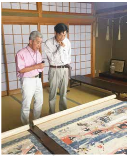
▲町指定有形文化財「天神曼荼羅」を見学いただきました (天満神社所蔵・非公開)