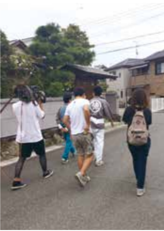
▲自慢を教えてくれる人を探しています

【放送局・番組名】 読売テレビ（10ch） レギュラー放送 「大阪ほんわかテレビ」 町村プラブラ〜稲美町編 【放送予定日】 10月20日（金） 19:00~20:00（予定） ※放送日時が変更になる場合は、町 Facebook でお知らせします。