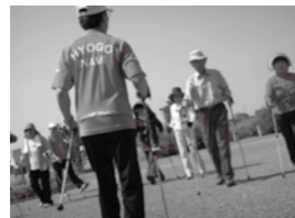
3月・5月・11月に開催しているボールウォーキング教室