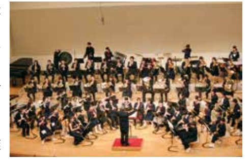
▲フィナーレを飾った大合奏