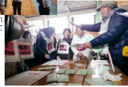
▲運営委員のメンバーが避難所の課題について話し合っています