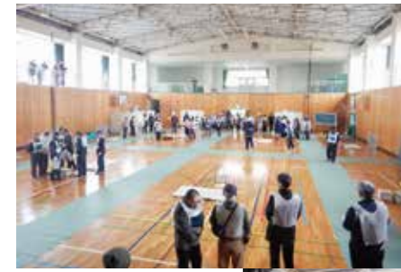
▲それぞれの班に分かれて打ち合わせを行っています