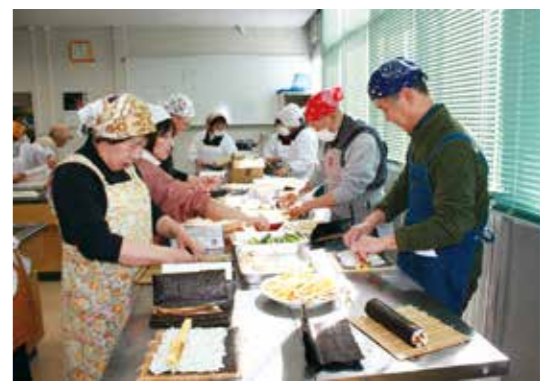
▲真剣に巻き寿司を作る参加者

この日、恵方巻きの具材に使用した食材はあなご、きゅうり、かまぼこ、厚焼き玉子、しいたけ、高野豆腐、にんじんの7種類。具材を7種類使うのは、縁起を担いで七福神にみたてているとのこと。酢飯、具材が用意できたところで、「福を巻き込む」ように、巻きすで1本1本丁寧に巻き上げました。