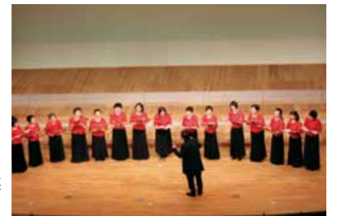
▲稲美フラウエンコールの合唱

最後は、稲美中学校吹奏楽部、稲美北中学校吹奏楽部、コスモシンフォニックウィンズによる日本の情景「冬」・「トゥーランドット」より誰も寝てはならぬの大合奏で、コスモホールはたいへん盛り上がりしました。