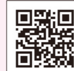
いなみ安心ネット http://bosai.net/inami/

インターネット接続できる携帯電話やパソコンで、次のURLを入力、 http://bosai.net/inami/ アクセスして 「◆お知らせメール◆⇒登録/解除」から登録してください。