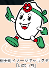
稲美町イメージキャラクター「いなっち」

「赤ちゃんふれあい教室」が町内の中学校で開催されました。少し緊張しながらも、優しい笑顔で赤ちゃんに声をかけたり、抱っこをしてあげていました。