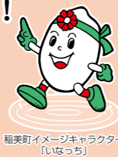
稲美町イメージキャラクター「いなっち」