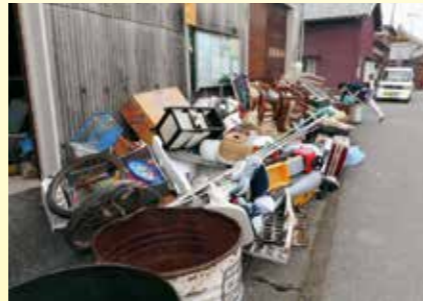
急増している粗大ごみ ▶

粗大ごみの状況を調査したところ、まだまだ使えるものや、可燃ごみや不燃ごみが正しく分別されずに粗大ごみとして出されているケースやテレビ・冷蔵庫・洗濯機・タイヤ・消火器・ふとんなどの収集できないものが出されているケースが多く見られました。これらのことが粗大ごみの主な増加原因と考えられます。