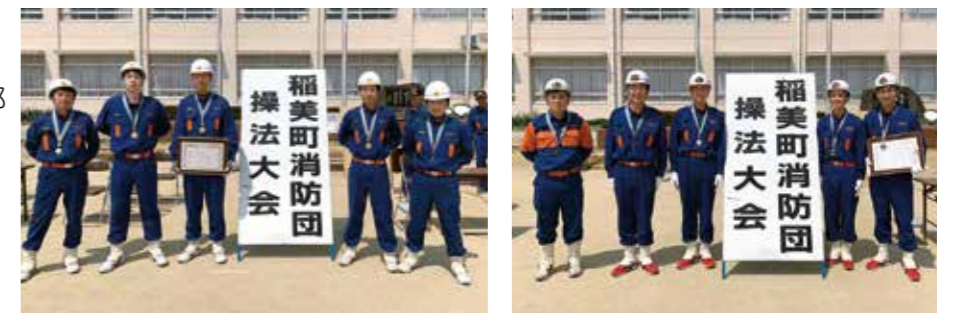
▲ 優勝 六分一部の皆さん ▲ 準優勝 印南第3部の皆さん