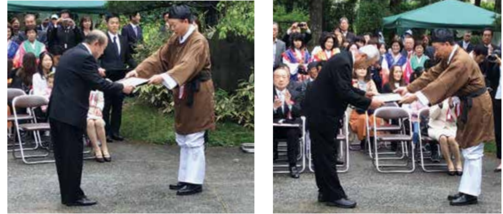
▲ 町長から稲美町商工会様に感謝状が贈呈されました ▲ 町長から稲美ライオンズクラブ様に感謝状が贈呈されました

除幕式には、令和元年に出産予定の妊婦さんなどをお招きし、出席者・観覧者を合わせ、100人を超える皆さんが参加しました。観覧に訪れた多くの方は、寄贈された記念碑と歌碑とともに記念撮影をし、新しい時代の幕開けを祝いました。ぜひこの機会に、いなみ野万葉の森にお立ち寄りください。