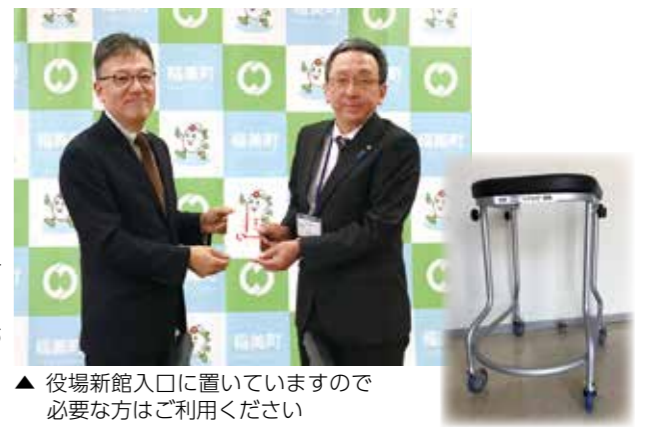
▲ 役場新館入口に置いてありますので必要な方はご利用ください

大阪ガス(株)では、1981年からグループ従業員の自発的な社会貢献活動として“小さな灯”運動に長年取り組まれており、地域の福祉向上のため活動を続けています。 今回、歩行器一台を寄贈いただきましたので、役場にお越しの際に必要な場合はご利用ください。