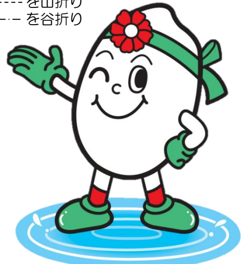
稲美町イメージキャラクター いなっち