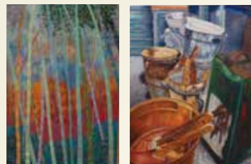
日本画の部 「竹林」 洋画の部 「父の仕事仲間」