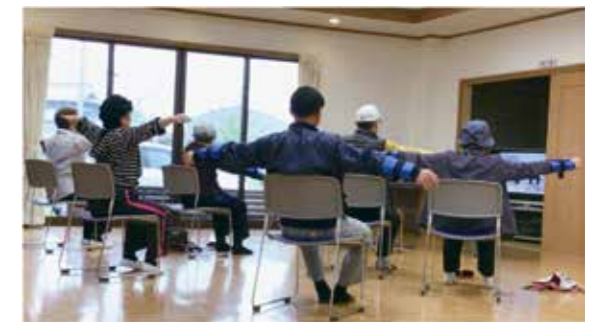
▲立ったり座ったりが楽になりますよ