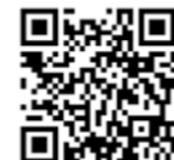
▲e-Tax ご利用の流れ (国税庁ホームページ)