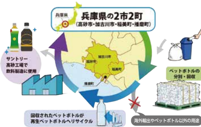
ペットボトルの「ボトル to ボトル」水平リサイクル