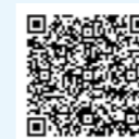
▲農林水産省ホームページ

https://www.maff.go.jp/kinki/seibi/sekei/kokuei/touban/top.html