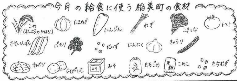
今日の給食に使う稲美町の食材