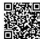
▲稲美町新型コロナワクチン接種予約システム

スマートフォンなどで右のQRコードを読み取り、「稲美町新型コロナワクチン接種予約システム」から予約をしてください。パソコンをお持ちの人は、町ホームページから予約することもできます。