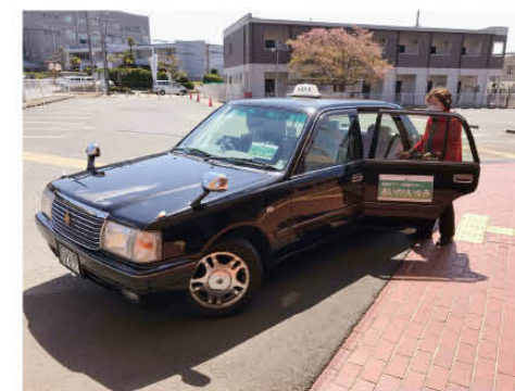
◀この車両が送迎します