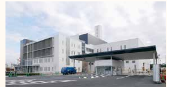
エコクリーンピアはりま