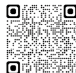
▲ひょうご森づくりサポートセンターホームページ

問合せ先 ひょうご森づくりサポートセンター (兵庫県木材業協同組合連合会内) ☎078-371-0607(平日9:00~17:00) 兵庫県 農林水産部 林務課 ☎078-341-7711(内線4122) URL: http://www.hyogomori.jp/sc/sc_kakakukoutou.html