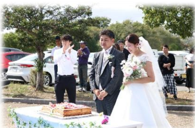
▲官学連携「いなみウエディング」