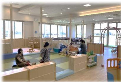
▲いなみっこ広場での子育て支援