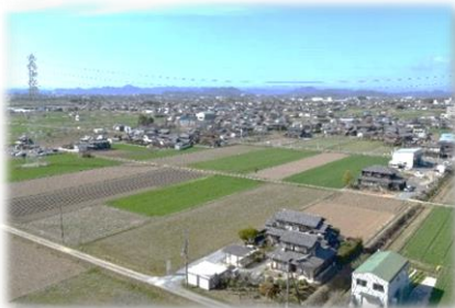
▲市街化調整区域の規制緩和・移住促進