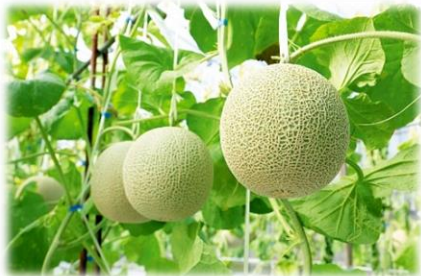
▲稲美ブランド「いなみのメロン」