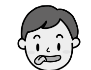
③舌を左右に動かす