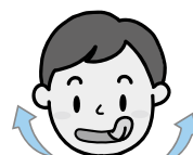
④口の周りを一周(左回り・右回り)