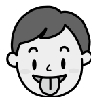
①舌を前に出し、下へ下げる