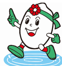
稲美町イメージキャラクター「いなっち」

ホームページ：http://www.town.hyogo-inami.lg.jp/