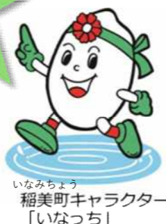
稲美町キャラクター「いなっち」

既存の管理棟は昭和52年に建てられたものです！ 40年以上経っても建物自体は健全な状況です！